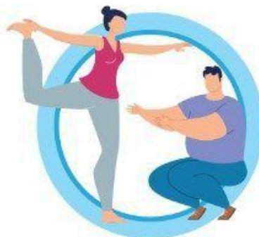
ВЕДИТЕ ЗДОРОВЬЙ ОБРАЗ ЖИЗНИ