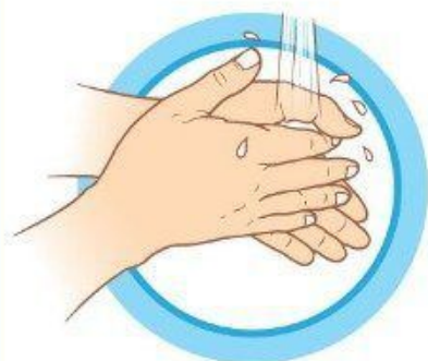
ЧАСТО МОЙТЕ РУКИ С МЫЛОМ