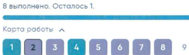
Рисунок 4. Карта работы

Если участник пропустил какой-то вопрос и хочет к нему вернуться, можно нажать кнопку «Назад» или выбрать номер пропущенного вопроса в карте работы (Рисунки 3, 4).